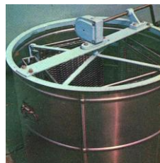
Рисунок 5. Медогонка

Хранить мед рекомендуется при температуре +5-6°C.