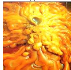
Рисунок 6. Воск

3.3. Воск (Рисунок 6, 7) – это второй по значению продукт пчеловодства, используемый пчелами для постройки сотов. Это жироподобное вещество, выделяемое восковыми железами молодых рабочих пчел (возраст 4-17 дней). Воск выделяется через мельчайшие отверстия и затвердевает на специальных восковых зеркальцах в нижней части брюшка (4 пары) 5-угольными пластинками. Свежевыделенный воск белый, затем он желтеет. При строительстве сотов с помощью ножек пчелы снимают восковые пластинки, разрыхляют их мандибулами (жвалами) и строят ячейки. Выделяют воск пчелы только в биологически полноценной пчелиной семье, где есть матка, трутни и достаточное количество пчел. Вне семьи отдельные пчелы и даже группы пчел, имеющие развитые восковыделительные железы, соты строить не могут.