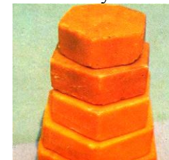
Рисунок 7. Воск