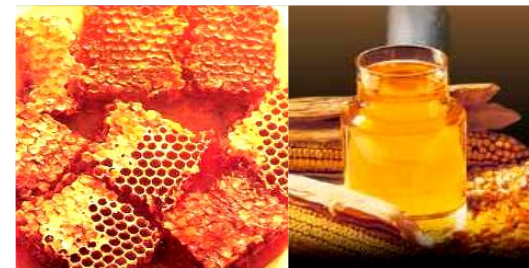
Рисунок 2. Мед в сотах. Рисунок 3. Мед.

3.1. Мед (рисунок 2, 3) – это сладкое вязкое ароматическое вещество, получаемое медоносными пчелами из нектара цветков или пади. Поэтому по происхождению различают три типа натурального меда: цветочный, падевый и смешанный. Среди цветочный различают: монофлерный и полифлерный.