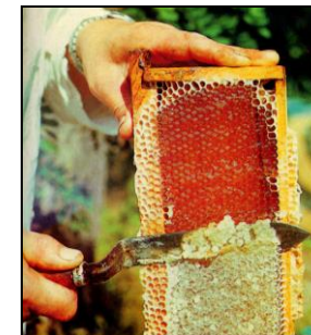
Рисунок 12. Срезание забруса

5. Воздух из улья – применяют для лечения органов дыхания, как общеукрепляющее средство путём вдыхания с помощью специальных приспособлений прямо из улья.