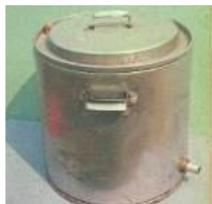
Рисунок 4. Медогонка