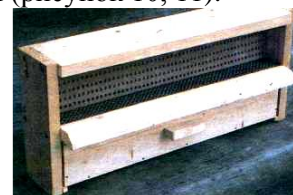
Рисунок 10. Пыльцеуловитель

Пыльца и перга по химическому составу несколько отличаются, т.к. в перге происходят биохимические процессы с образованием молочной кислоты, причём пчелы иногда запечатывают такие ячейки. В пыльце сахаров 18%, в перге – 34,8%, жиров соответственно 3,33% и 1,58%, белков – 24,06% и 21,74%, минеральных веществ – 2,55% и 2,43%, молочной кислоты – 0,55% и 3,06%. Человек получает пыльцу путем навешивания на леток пыльцеуловителя (рисунок 10, 11).