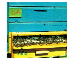
Рисунок 11. Установленный на леток пыльцеуловитель